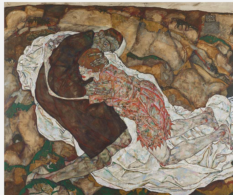
La morte e la fanciulla, Egon Schiele