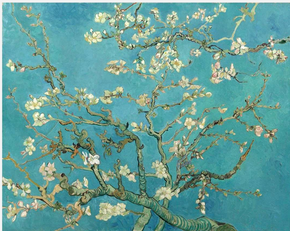
Ramo di mandorlo fiorito, Vincent Van Gogh